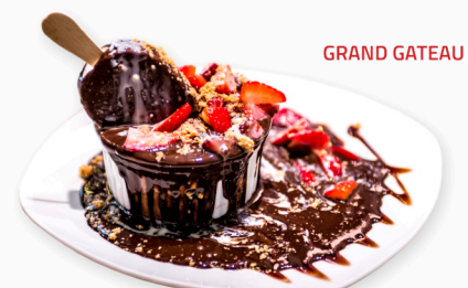
GRAND GATEAU PARIS